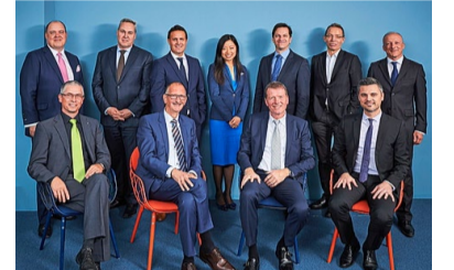
^ Die Jurymitglieder 2018.